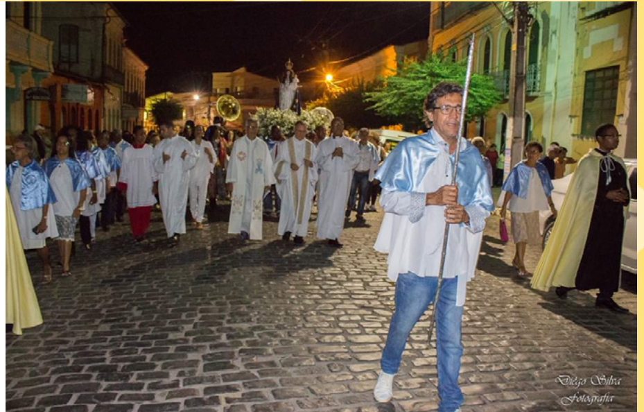
A Festa D'Ajuda tem samba, tradição e um forte apelo popular. Além das comemorações religiosas, há desfile de Ternos (mascarados, cabeçorras, mandus etc.) pelas principais ruas de Cachoeira.

Patrimônio Imaterial da Bahia graças às pesquisas e dossiê da equipe multidisciplinar do Instituto do Patrimônio Artístico e Cultural (IPAC) da Secretaria de Cultura (SecultBA), a festa hoje se destaca no Recôncavo Baiano como uma importante manifestação popular. São cabeçorras, mandus, mascarados, velhos, meninos, meninas, diabos, santos e o povo, pelas ruas cantando músicas e letras singulares, das históricas filarmônicas, percorrendo as ruas da histórica cidade. A Festa inicia-se com o Bando Anunciador sempre na primeira quinzena de novembro. Ele é composto por carros, caminhões e carroças ornamentadas, desfilando pelas principais ruas da cidade, com charanga que convida a população para participar.