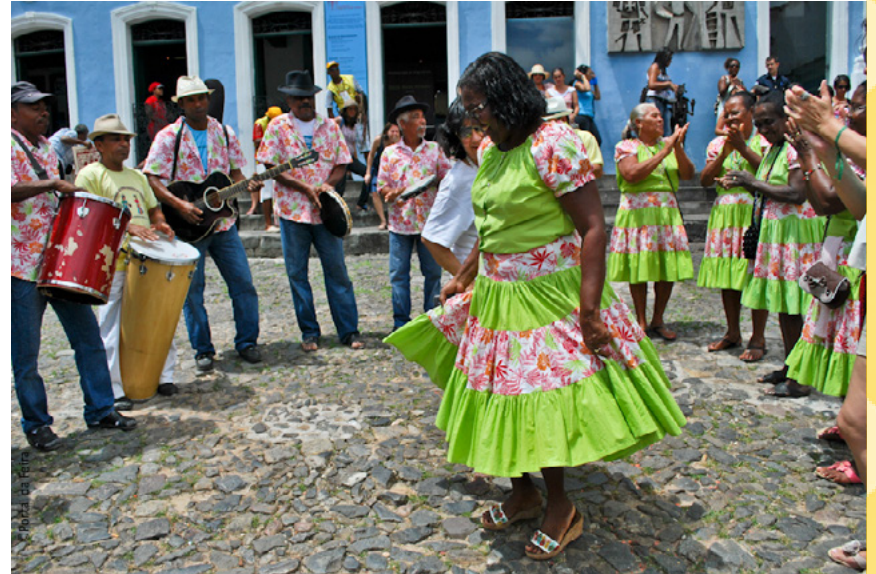
Festival de Samba de Roda 2016, em Cachoeira-BA. O samba de roda é uma forma de preservação da cultura negra no Brasil.

O grupo Esmola Cantada surgiu da devoção à Santa Cruz e tem relações sincréticas com o Candomblé. Atualmente é composto por 23 integrantes, dos quais 7 são da primeira geração (1957). "O nome Esmola Cantada é pelo fato de o grupo sair, três vezes ao ano, para pedir donativos cantando pelo bairro, visitando cada casa