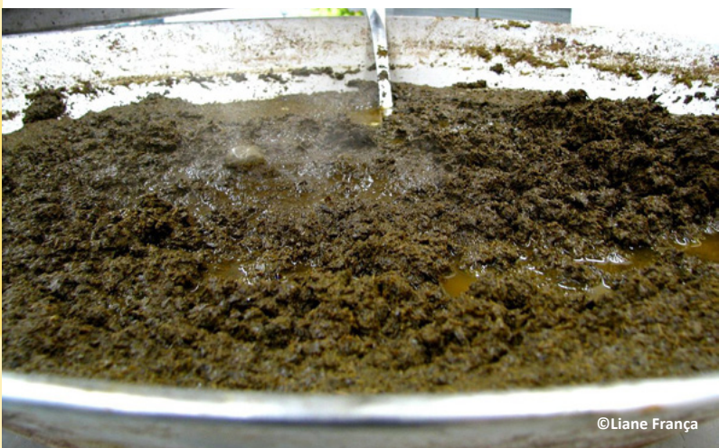
Maniçoba pronta para o consumo.

ACARAJÉ – bolinho frito de feijão, recheado com vatapá