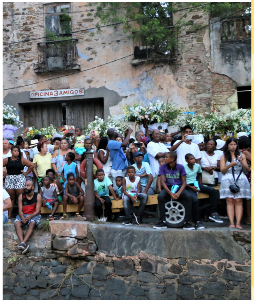
A Festa de Iemanjá reúne pessoas de diversos lugares da Bahia. É uma celebração à memória e a identidade do povo negro na Bahia.