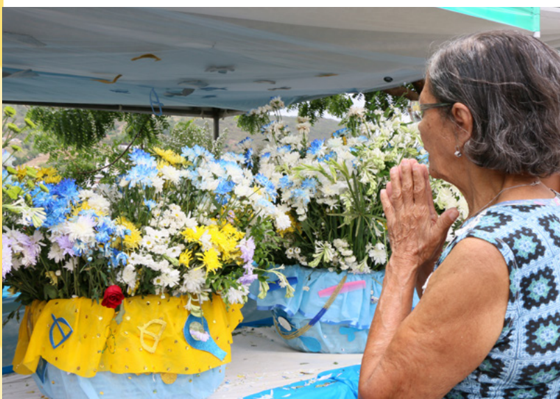
Flores, perfumes, jóias, pentes e espelhos são os principais presentes que os devotos levam como agradecimento e também fazendo pedidos para Iemanjá.

De acordo com o antropólogo, as festas do Bonfim, Iemanjá e Santa Bárbara têm conseguido sobreviver e alcançam muita visibilidade porque, além do prestígio dos santos festejados, que é muito grande em relação