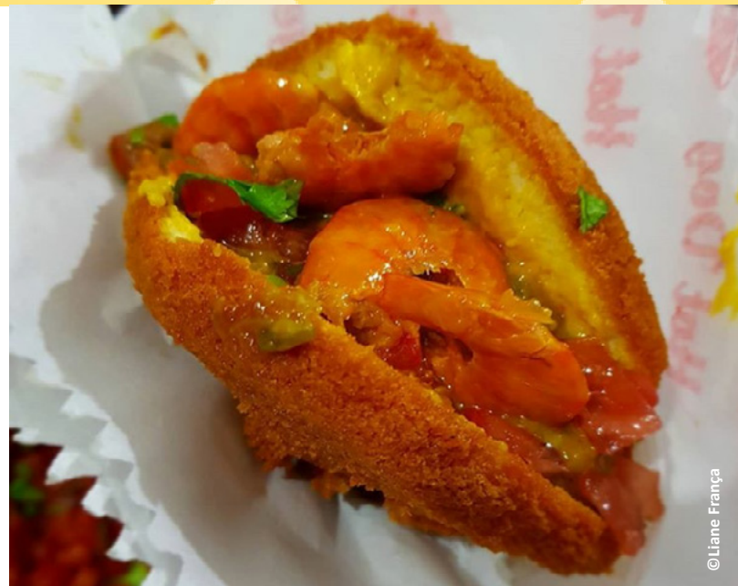
Acarajé quentinha e devidamente recheada.