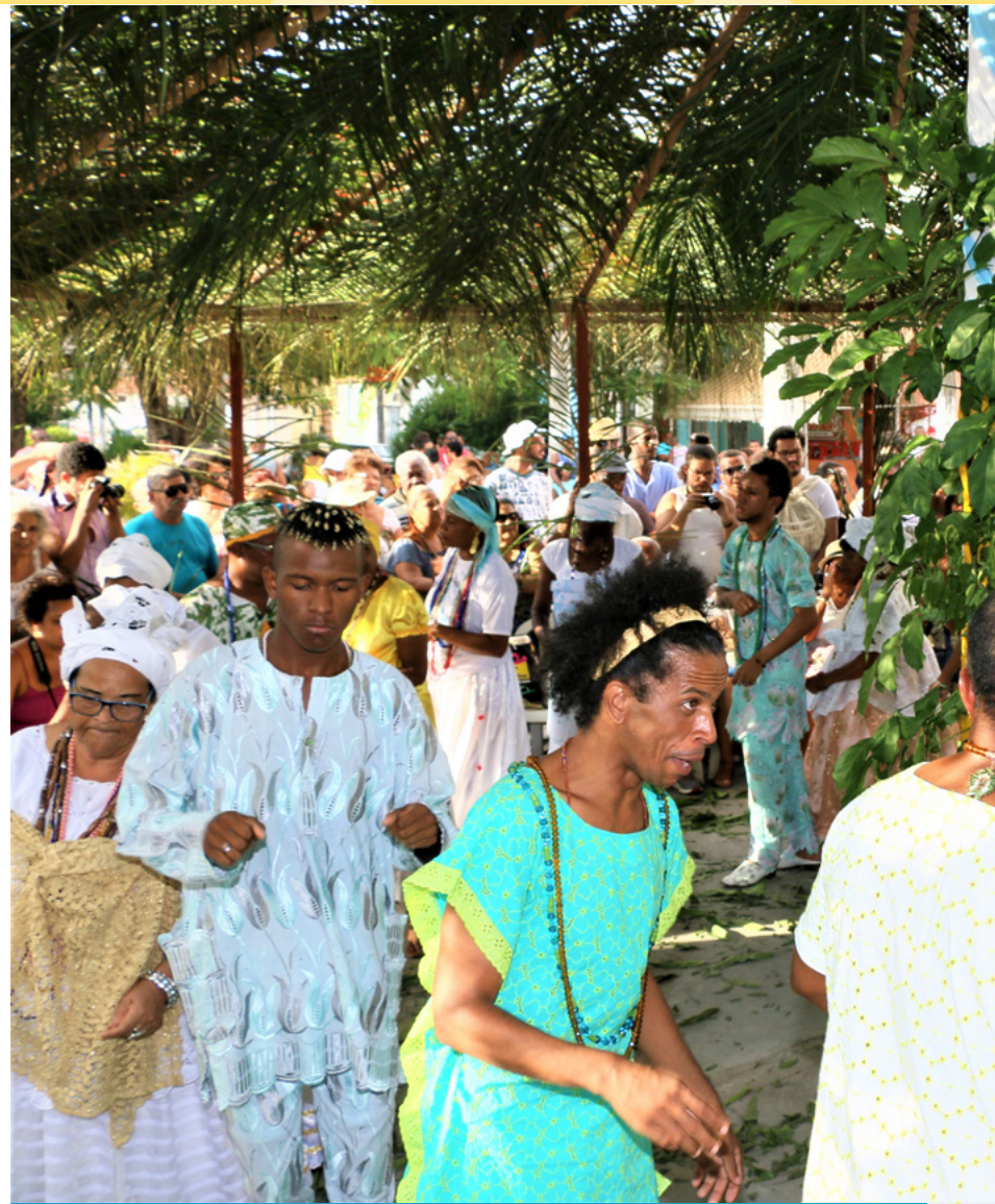
O Xirê é um ritual preparatório para entrega das oferendas à Iemanjá.

Na Festa de Iemanjá acontecem rituais segundo as tradições e religiosidade de matriz africana e alguns são restritos aos devotos nos terreiros de Candomblé, como os sacrifícios. Mas há também ritual público – o Xirê, quando adeptos e simpatizantes do Candomblé cantam e dançam antes da entrega das oferendas à Iemanjá. Em Cachoeira, a festa reúne pessoas de diversos lugares da Bahia, e acontece desde 2006, no primeiro