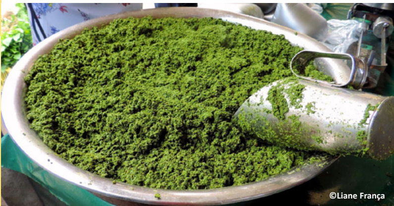
Folha da mandioca tritura e sequinha.

Coloque a maniva pré-cozida em uma panela grande com água. Enquanto isso, corte e prepare as carnes e coloque na panela de pressão por 30 a 40 minutos. Faça um refogado com cebola, alho, pimenta de cheiro, folhas de louro, bacon e deixe dourar. Depois que saírem da panela de pressão, acrescente todas as carnes nesse refogado e mexa bem. Após cozinhar bem, jogue as carnes dentro da panela com a maniva. Deixe cozinhar bastante e sirva.