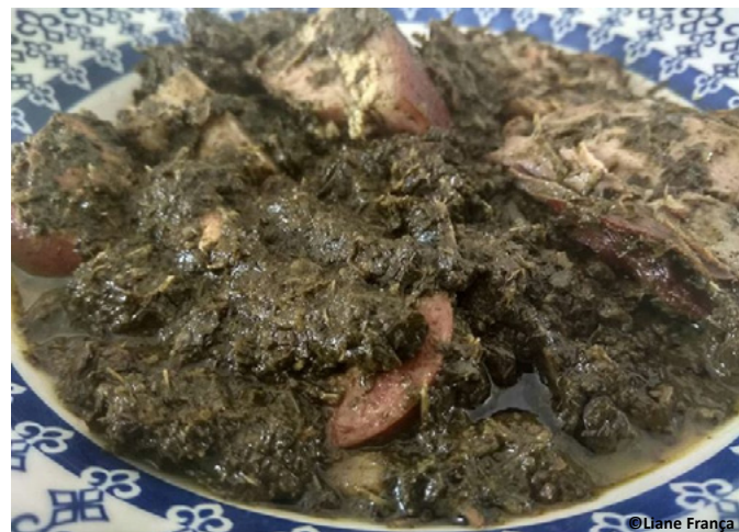
Maniçoba pronta para o consumo.

Nossa equipe procurou uma receita caseira e saborosa para compartilhar com vocês. Acesse nossa Revista online e confira a receita ( https://issuu.com/reverso/docs/reverso_106 ).